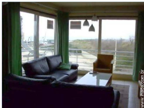
vista a partir da sala de estar

Estacionamento coberto : 1 colectivo(s)/ lugar de garagem