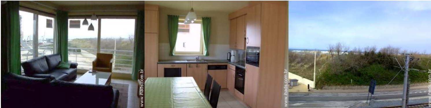
vista a partir da sala de estar