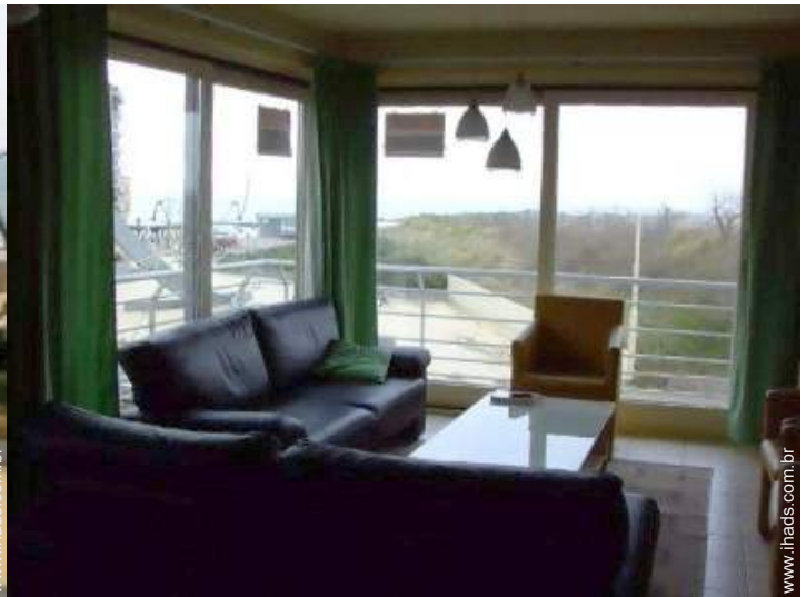
vista a partir da sala de estar