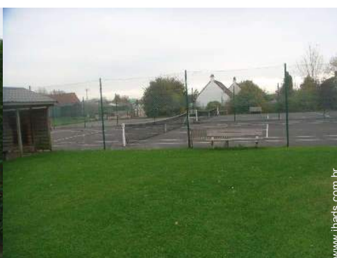
Tênis - superfície dura