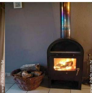
fogão a lenha