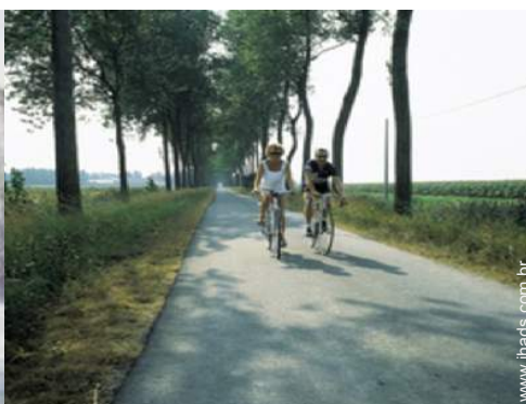
atividades nas proximidades