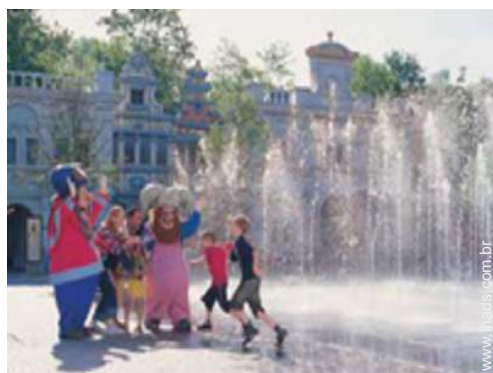
parque de lazer