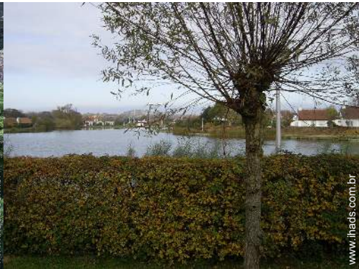
parque e jardim