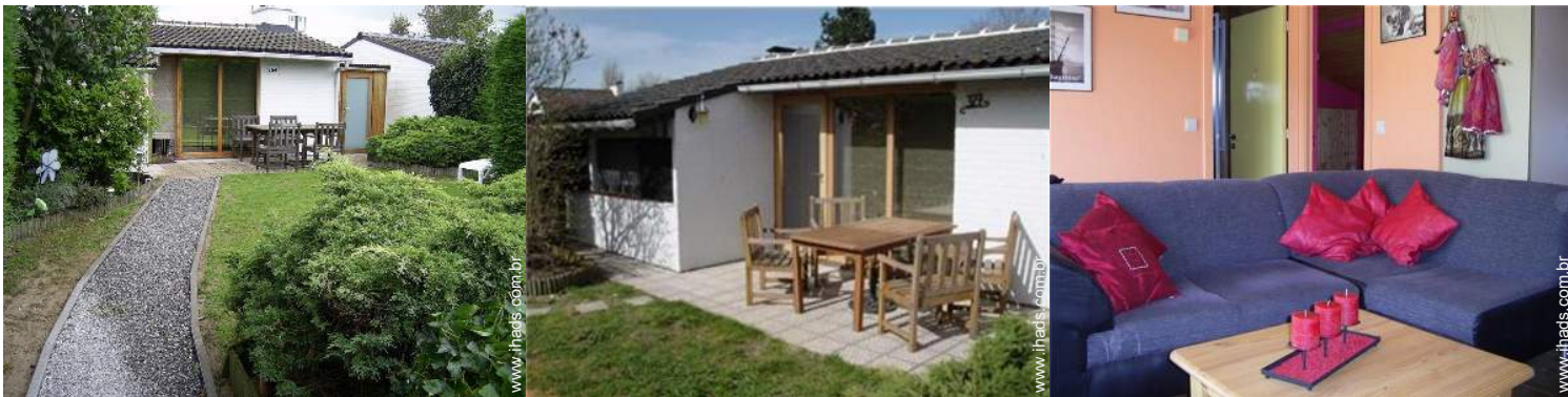
cadeira(s) de jardim