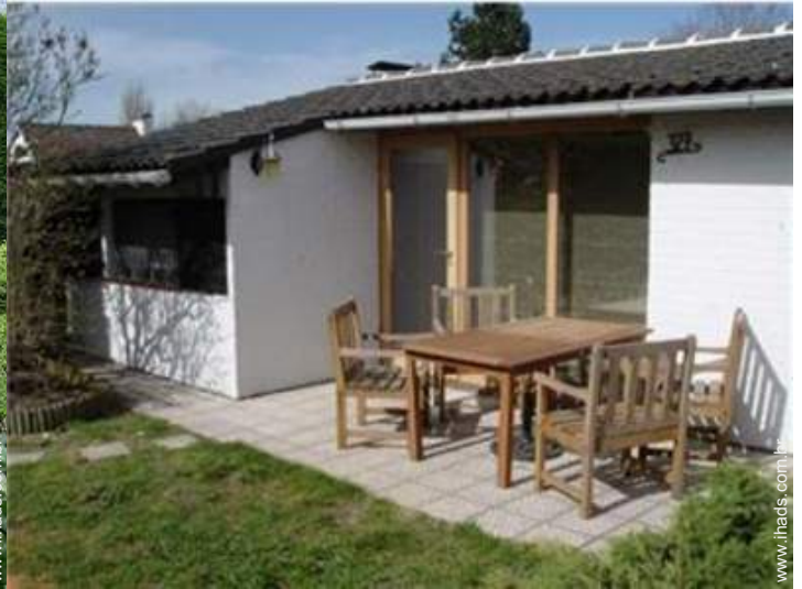
cadeira(s) de jardim