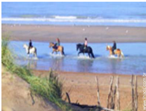
actividades balneares nas proximidades