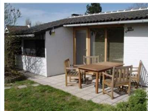
cadeira(s) de jardim