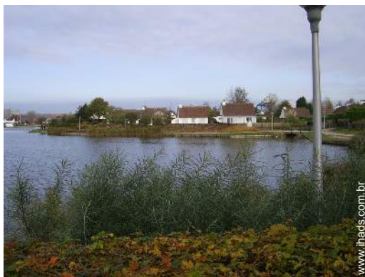
caminho de passeio