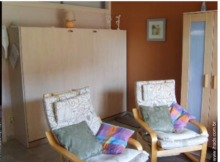
cama(s) convertível/eis dupla(s)