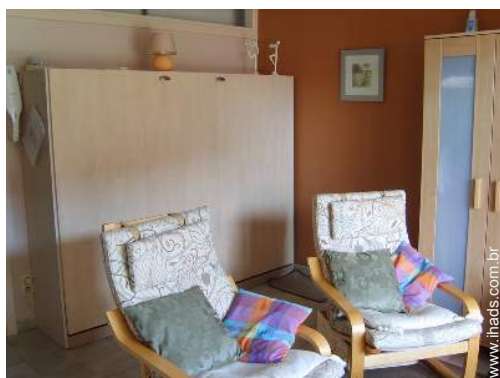
cama(s) convertível/eis dupla(s)