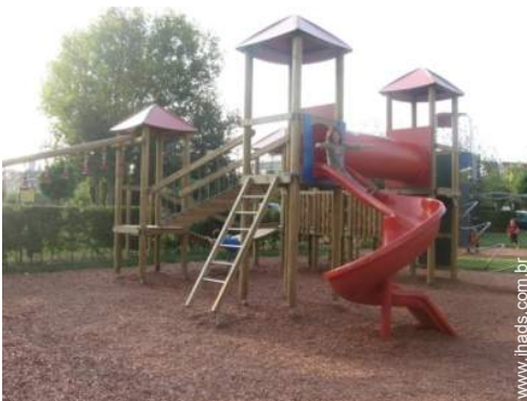
Atrações e lazer