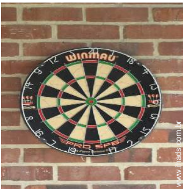
jogos de setas