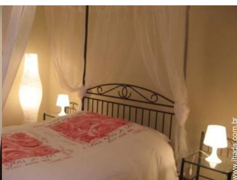
cama(s) de casal com dossel