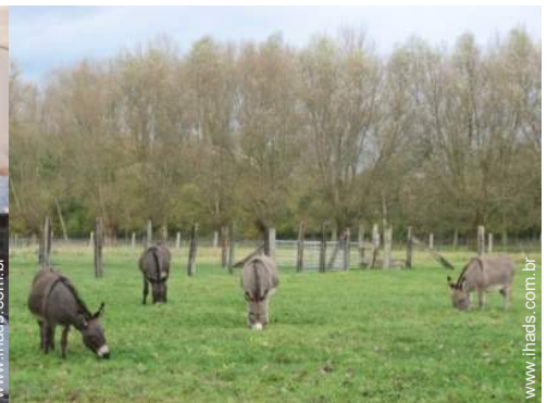
vista para pradaria