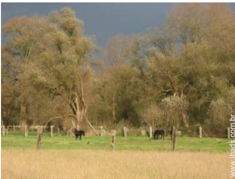
vista para pradaria