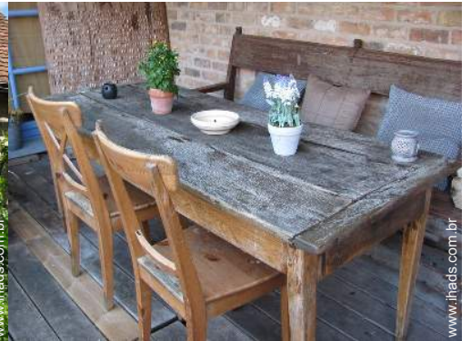
Instalações exteriores à disposição dos hóspedes