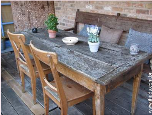
Instalações exteriores à disposição dos hóspedes