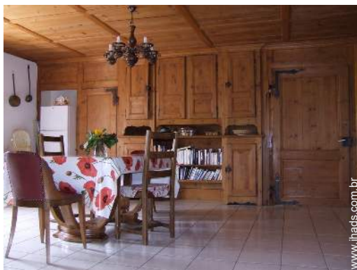
vista a partir do apartamento