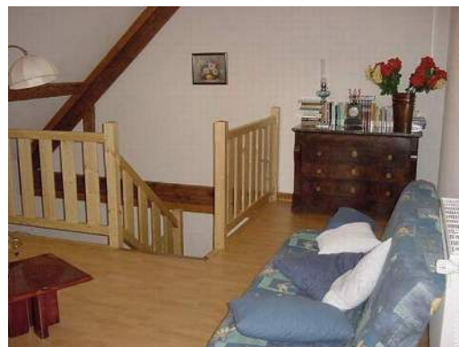
vista a partir da mezzanine