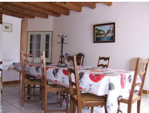
vista a partir da sala de jantar