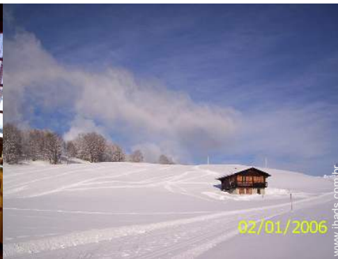
atividades de montanha nas proximidades