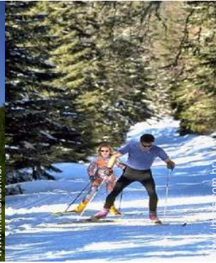
esqui de fundo