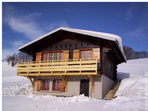
atividades de inverno nas proximidades