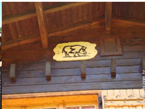
Os animais da casa