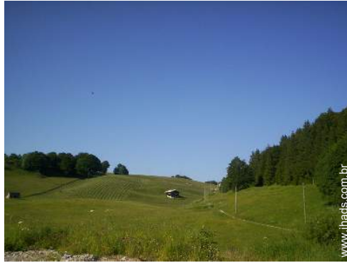
Chalé de Montanha