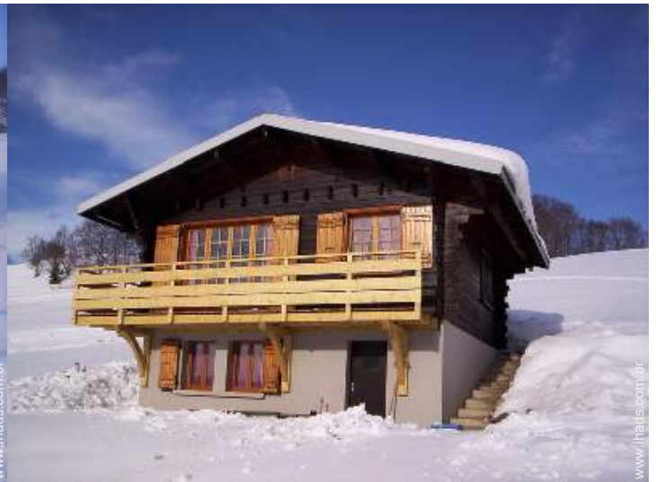
atividades de inverno nas proximidades