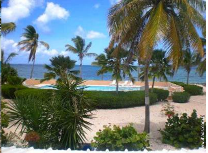
piscina na residência