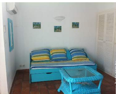
sofá(s) cama 2 pessoas