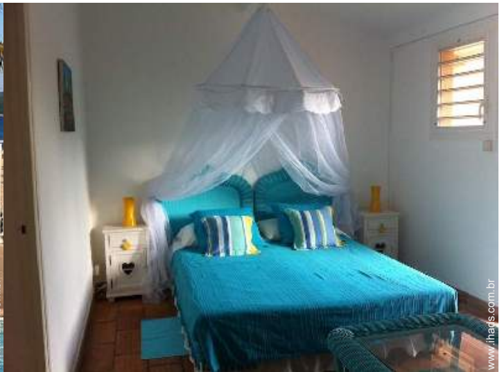
Dormida - cama(s)