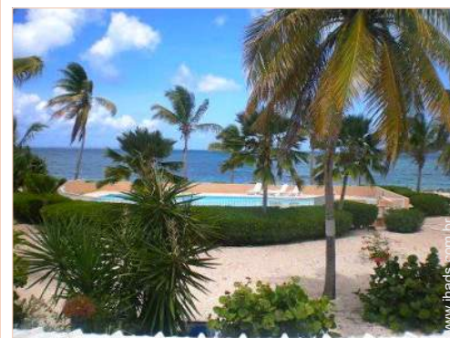
piscina na residência