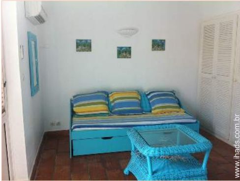
sofá(s) cama 2 pessoas