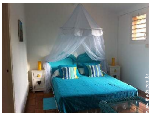
Dormida - cama(s)