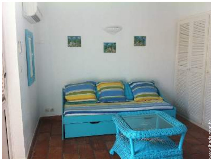
sofá(s) cama 2 pessoas