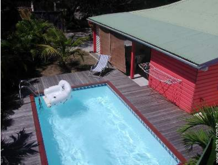
visão de conjunto