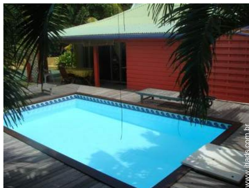
vista a partir da piscina