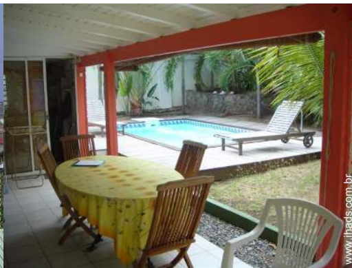
vista a partir do terraço coberto