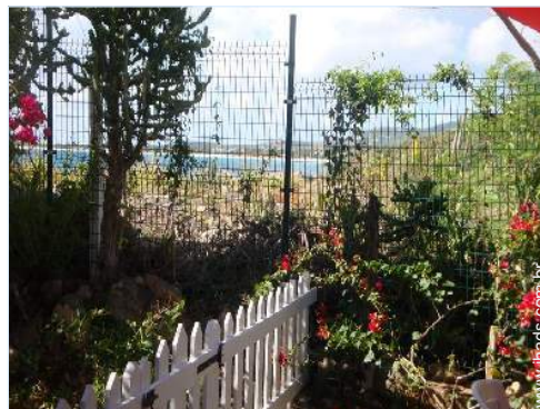
vista a partir do apartamento