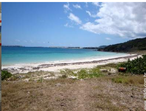
acesso directo à praia