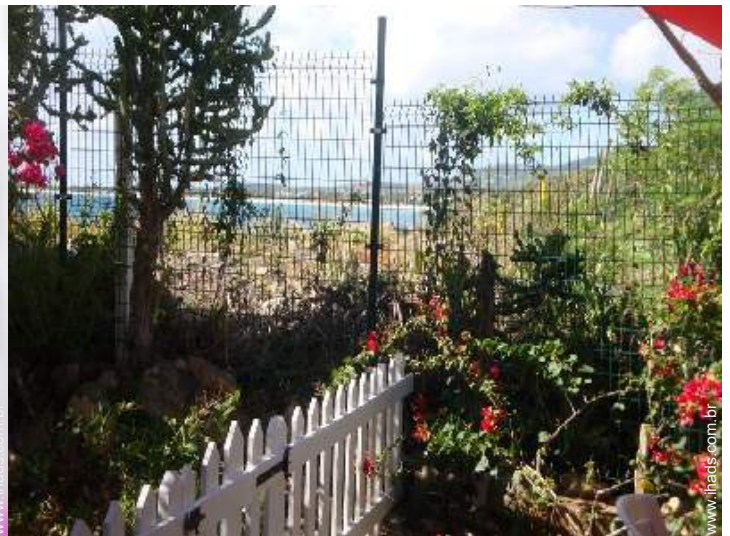
vista a partir do apartamento