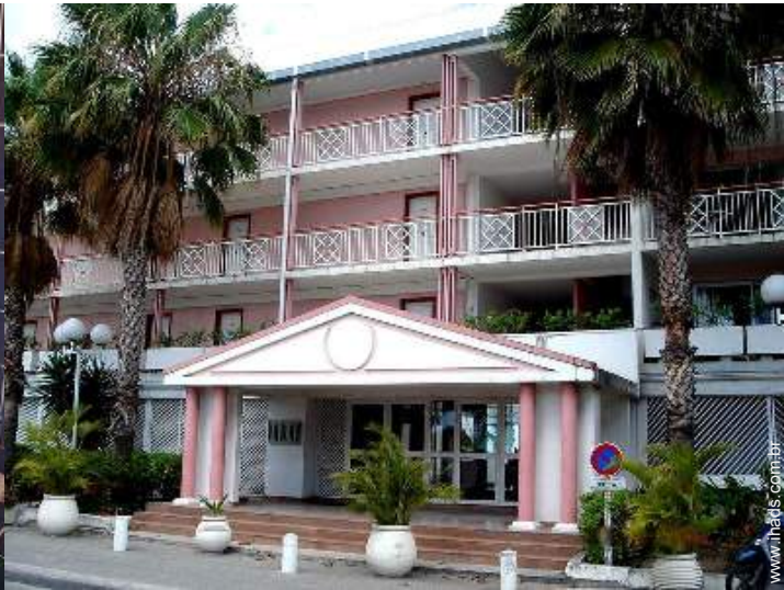
Residência de qualidade