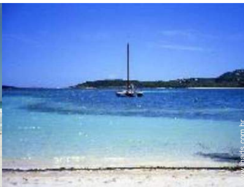
atividades náuticas nas proximidades