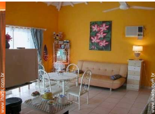
sofá(s) cama 1 pessoa