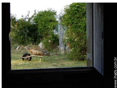
vista de campo