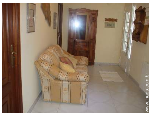
Conforto interior e equipamentos