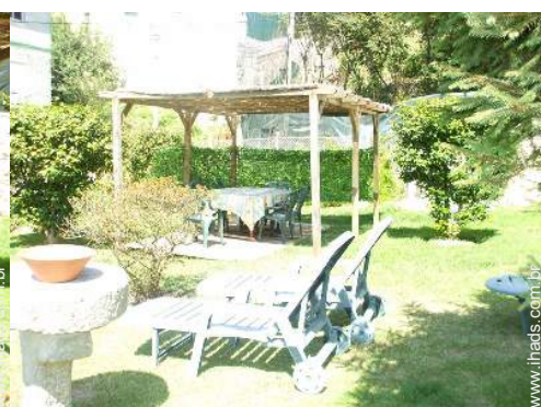
cadeira(s) de praia