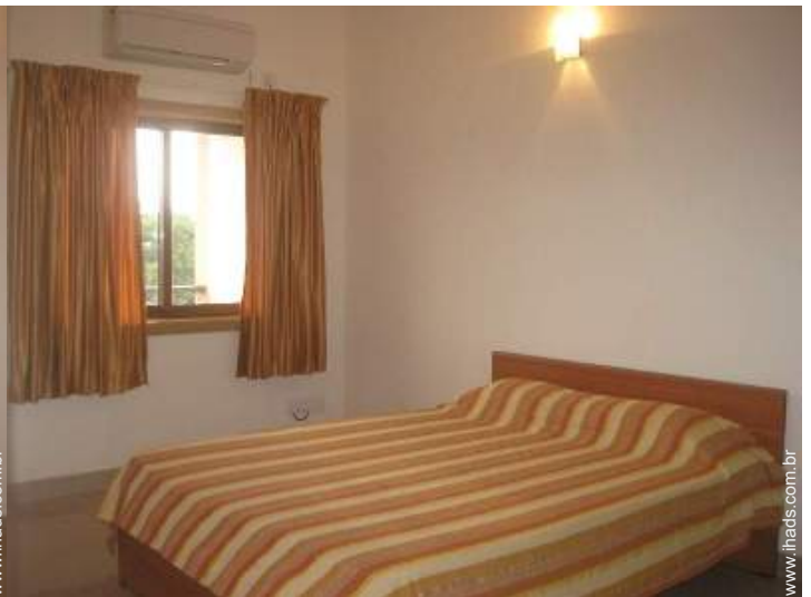
quarto de amigos