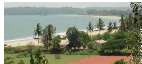
acesso directo à praia