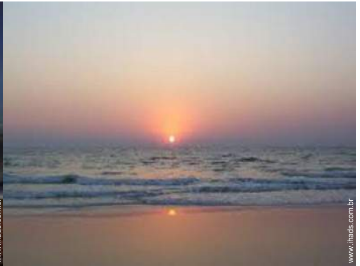
vista rua para peões