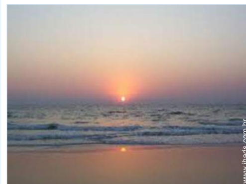
vista rua para peões