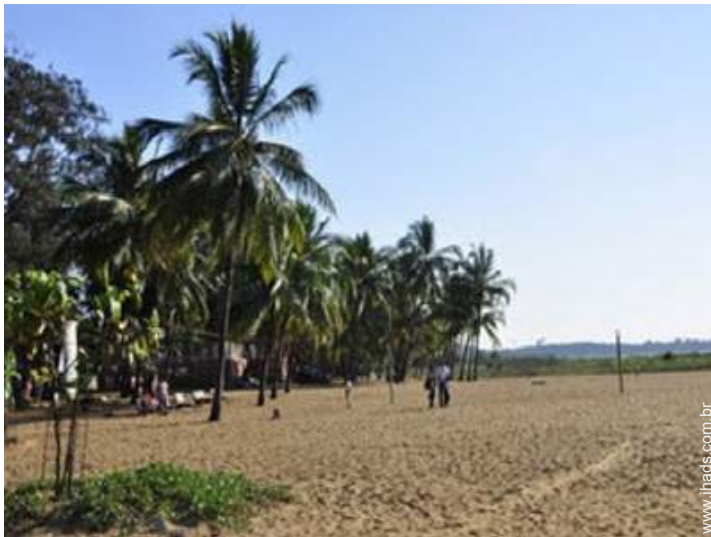
atividades náuticas nas proximidades