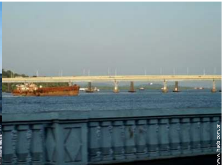
vista para rio