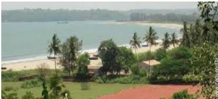
acesso directo à praia