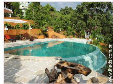
Ambiente exterior à disposição dos hóspedes