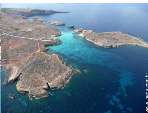
actividades balneares nas proximidades