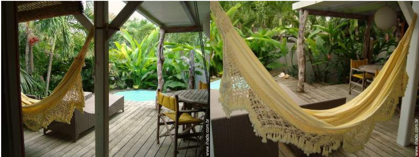
cama de rede