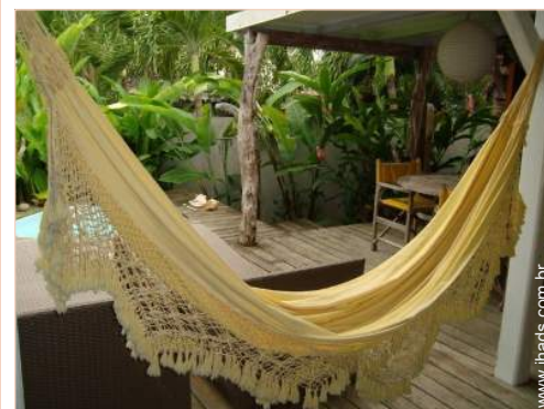
cama de rede