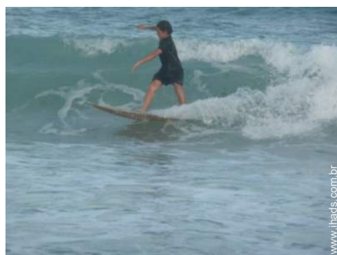
actividades náuticas nas proximidades