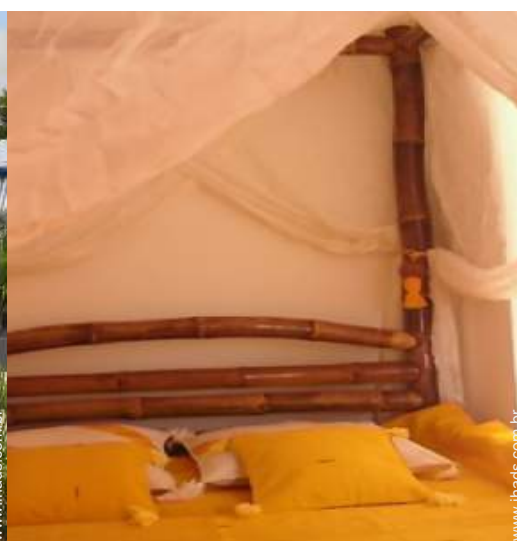
Propriedade de Encanto