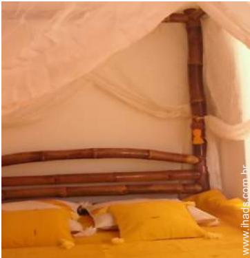
Propriedade de Encanto