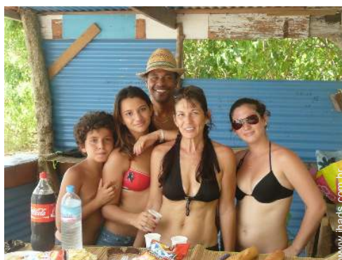
Os seus hóspedes