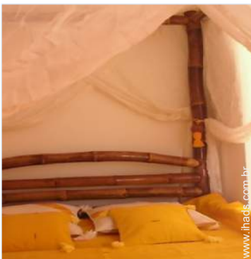
Propriedade de Encanto