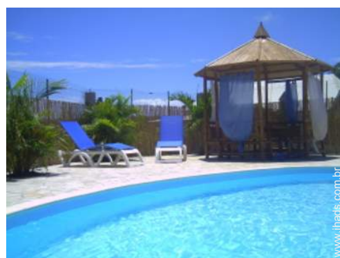
wi-fi (acesso à Internet sem fios)