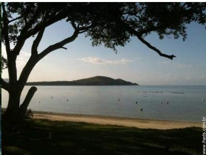
acesso directo à praia