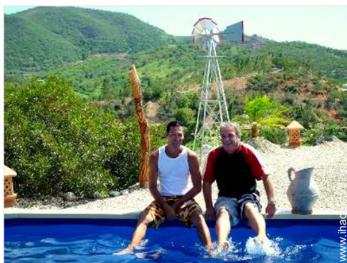
Os seus hóspedes