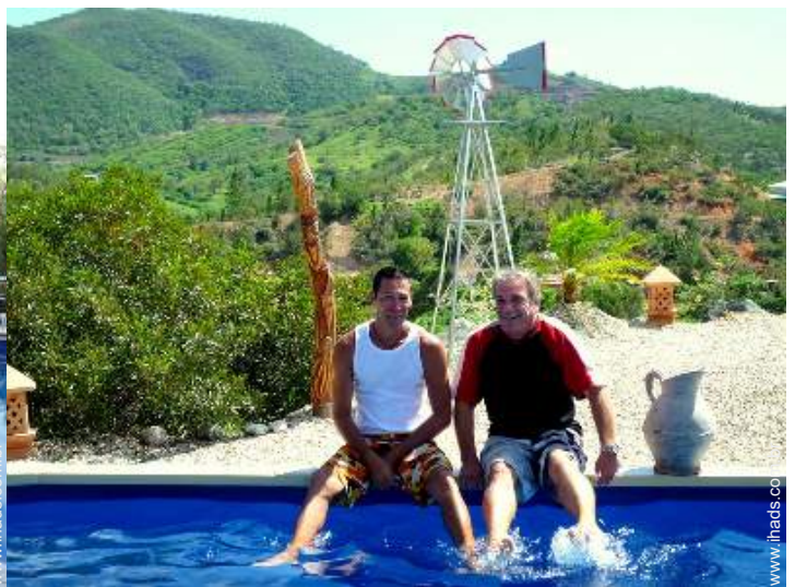
Os seus hóspedes