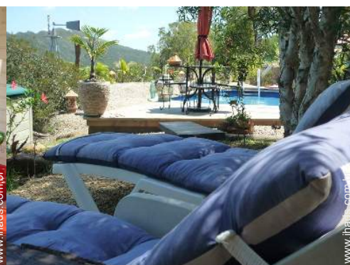
Instalações exteriores à disposição dos hóspedes