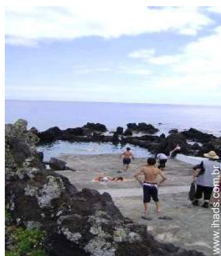
actividades de verão nas proximidades