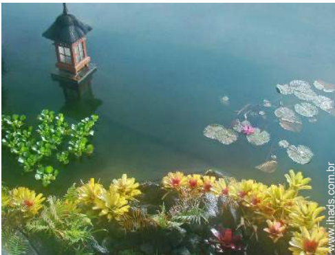
lago de jardim