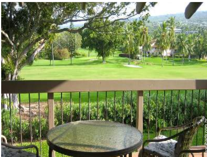
vista a partir do pátio