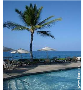
Equipamentos exteriores à disposição dos hóspedes

Barbecue a gás, mesa(s) de jardim, 4 cadeira(s) de jardim, 2 espreguiçadeira(s)