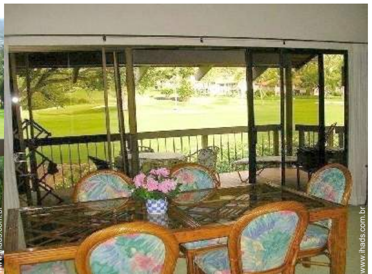
vista a partir da sala de jantar