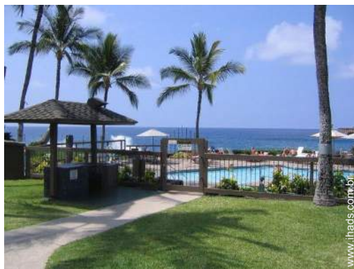
Ambiente exterior à disposição dos hóspedes