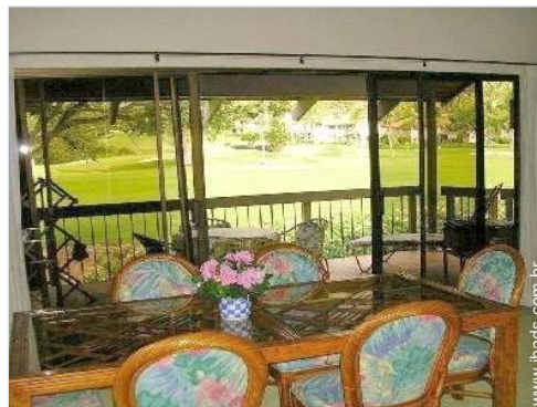
vista a partir da sala de jantar

Aluguer não fumadores, cobertura de rede telemóvel