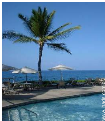
Equipamentos exteriores à disposição dos hóspedes