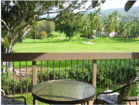
vista a partir do pátio