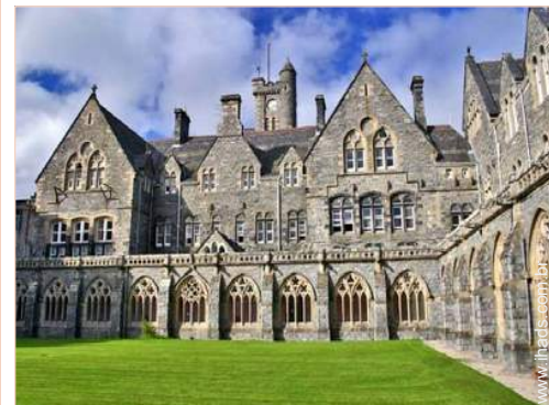
vista de pátio