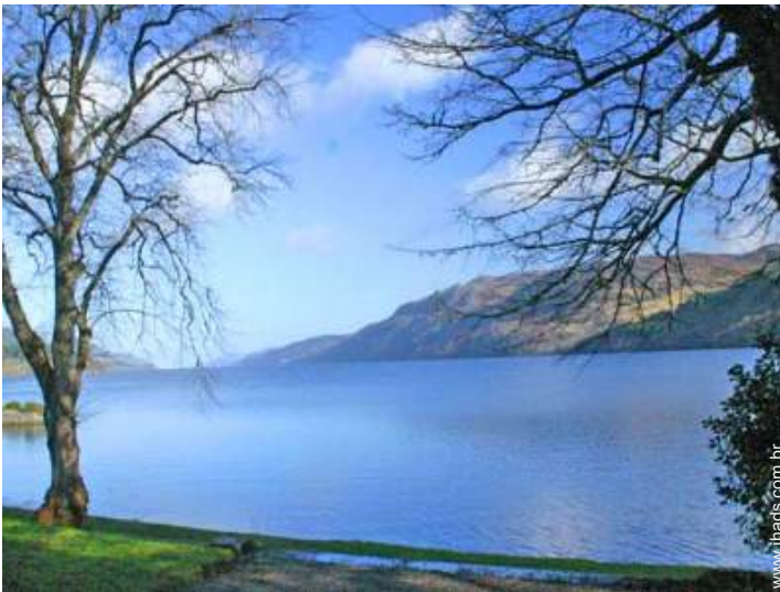
excursão de barco