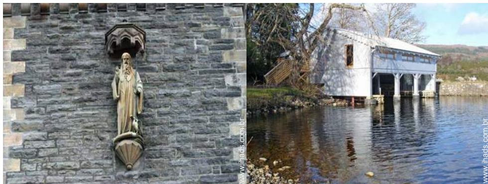
posto de amarração