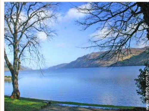
excursão de barco