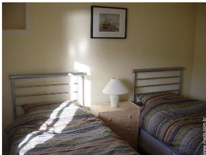
camas separadas simples