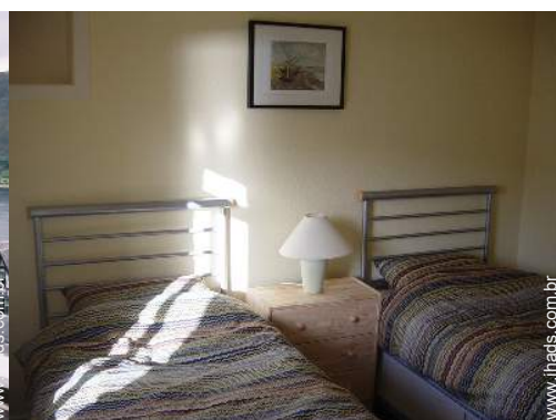
camas separadas simples