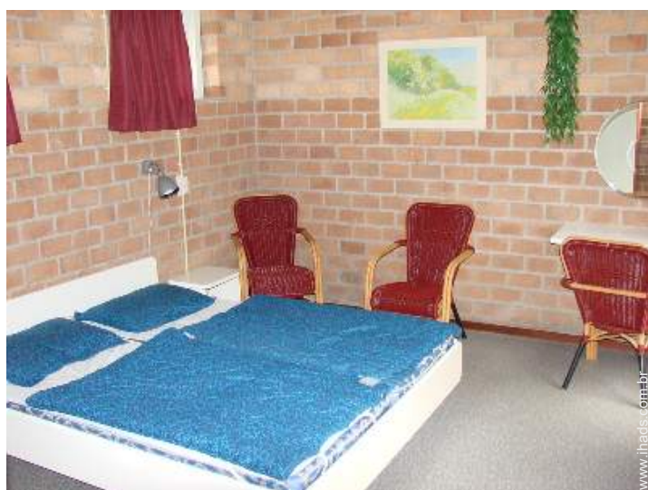
camas separadas simples