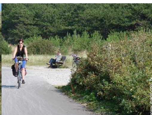
actividades nas proximidades