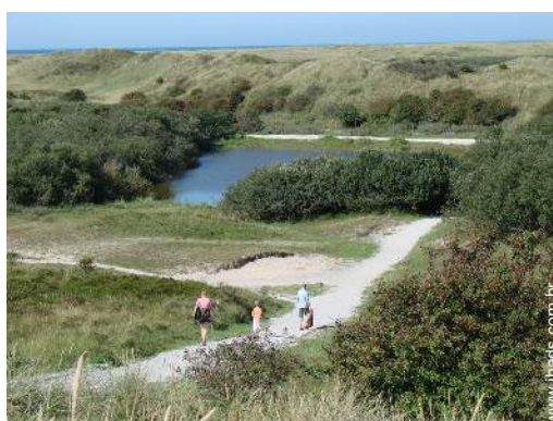
actividades nas proximidades