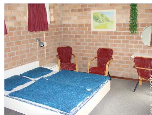
camas separadas simples