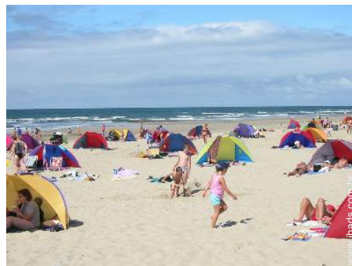
actividades balneares nas proximidades