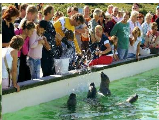
actividades nas proximidades