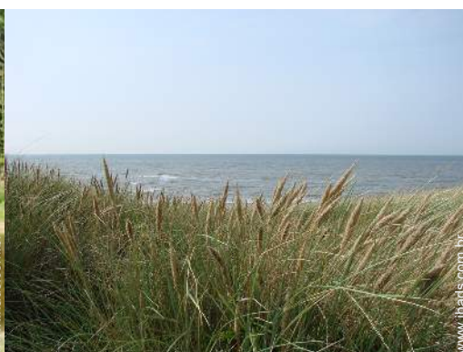
actividades balneares nas proximidades