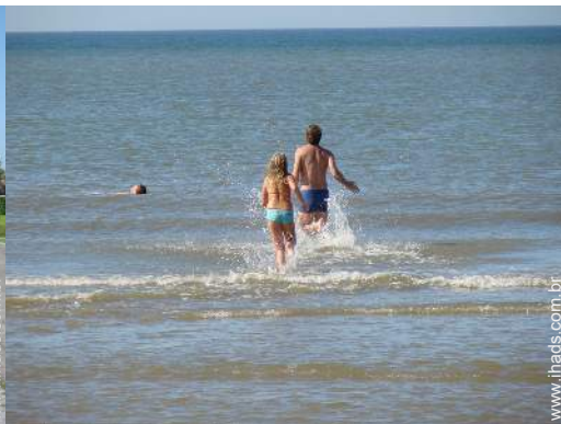
actividades balneares nas proximidades