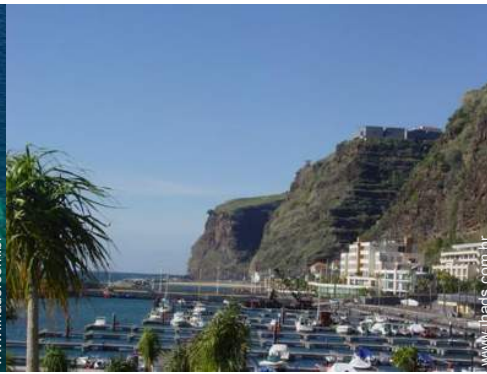
porto de recreio