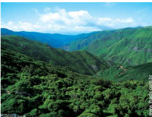
actividades de montanha nas proximidades