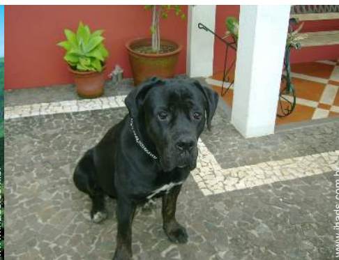
Os animais da casa