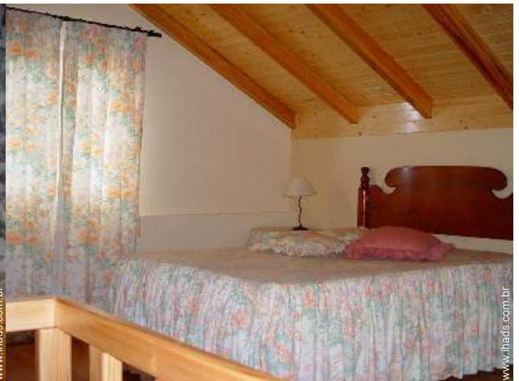
cama(s) de casal