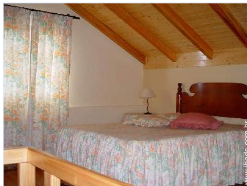
cama(s) de casal