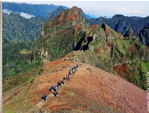
atividades aéreas nas proximidades