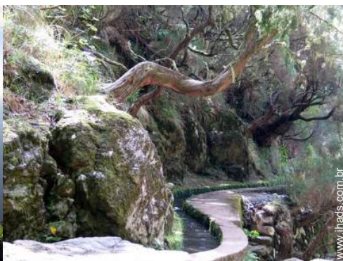
atividades de montanha nas proximidades