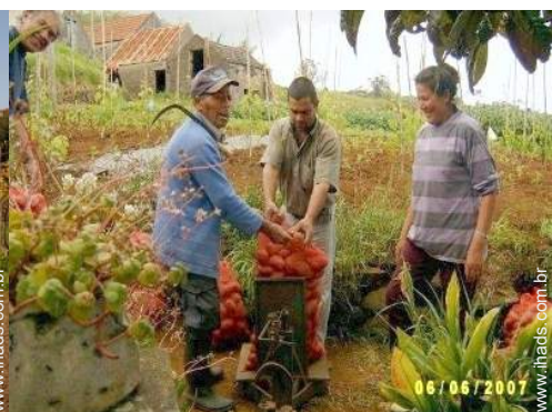
vista para campos agrícolas