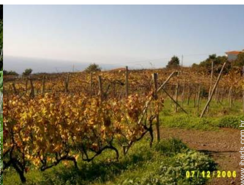
vista sobre vinhas