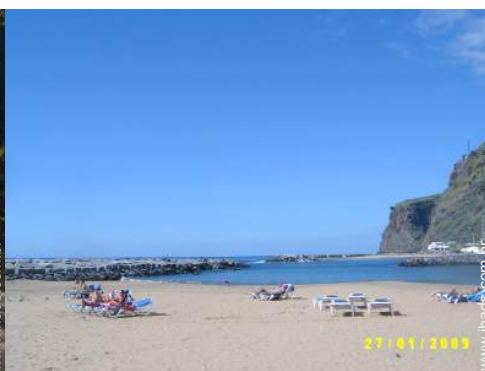
actividades balneares nas proximidades