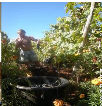
Ambiente exterior à disposição dos hóspedes