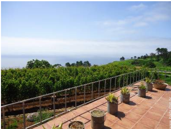
vista sobre vinhas