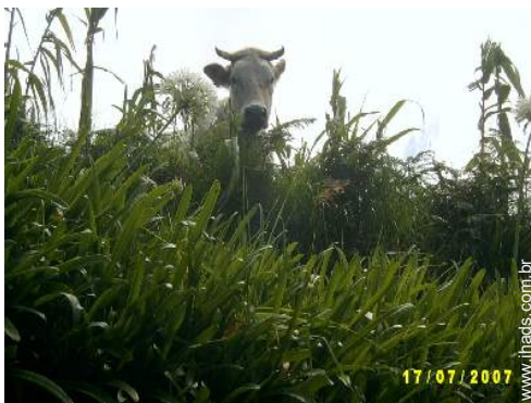
vista para pradaria