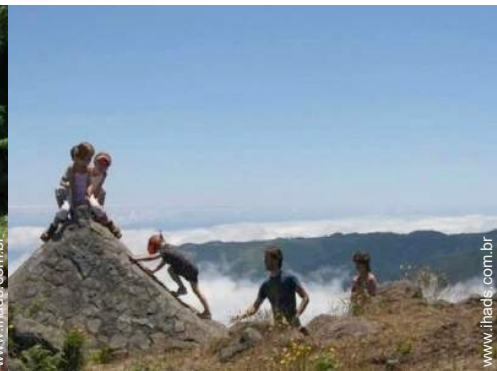
escalada em rocha