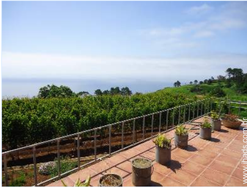
vista sobre vinhas