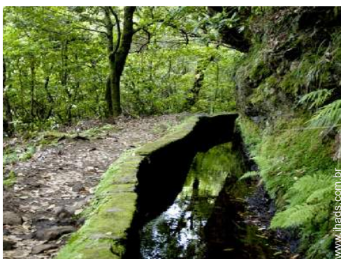
caminho de passeio