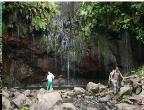
actividades nas proximidades