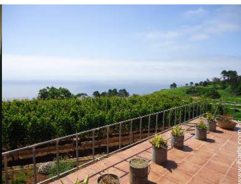
vista sobre vinhas