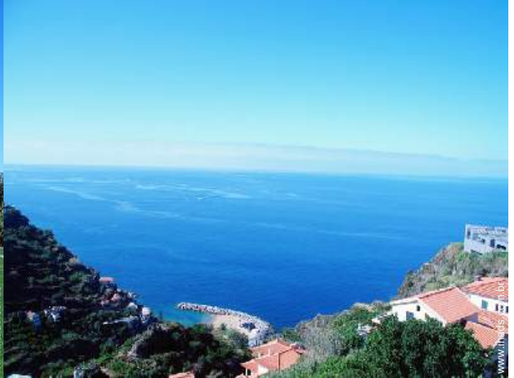
vista a partir da varanda