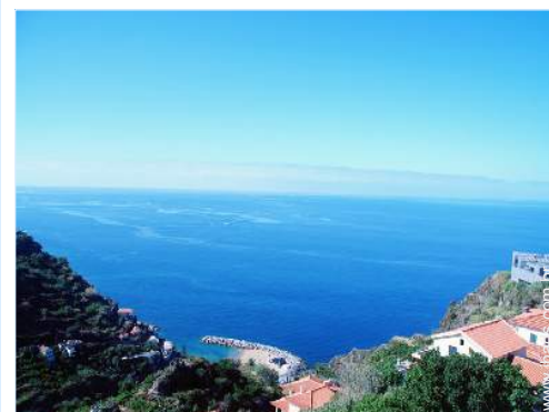
vista a partir da varanda