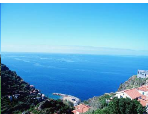
vista a partir da varanda