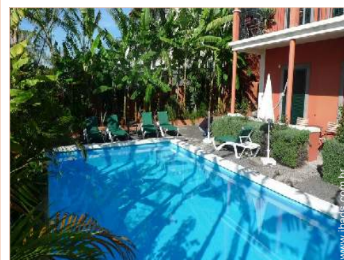
piscina na residência