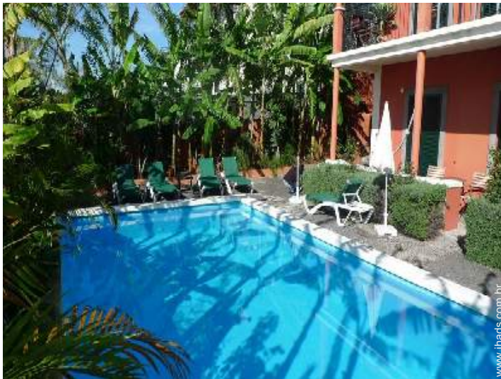
piscina na residência