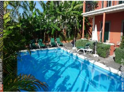
piscina na residência