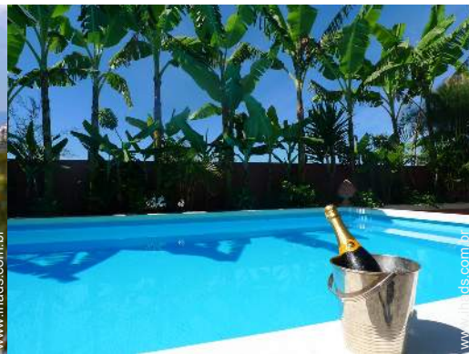
piscina na residência