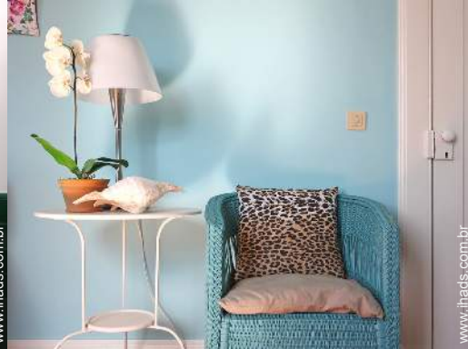
Vivenda de Encanto