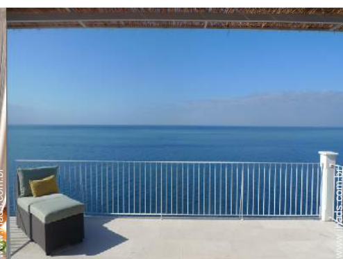
terraço no telhado