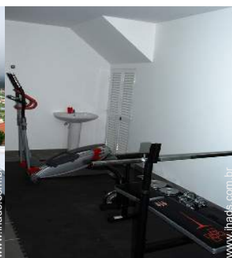
equipamento de musculação