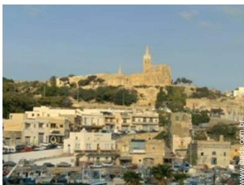
Atrações e lazer