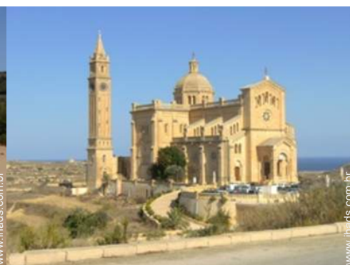
Atrações e lazer