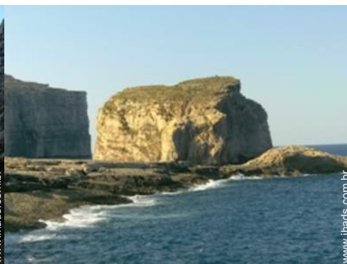
Atrações e lazer