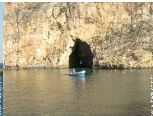
Atrações e lazer