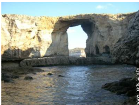
Atrações e lazer