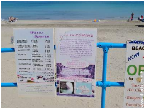
atividades náuticas nas proximidades