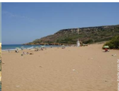
Atrações e lazer