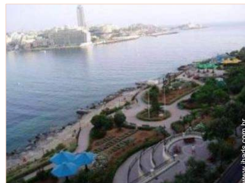
parque de lazer