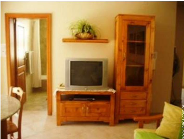
wi-fi (acesso à Internet sem fios)