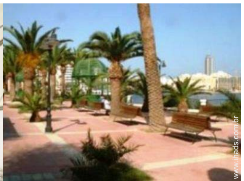
parque e jardim