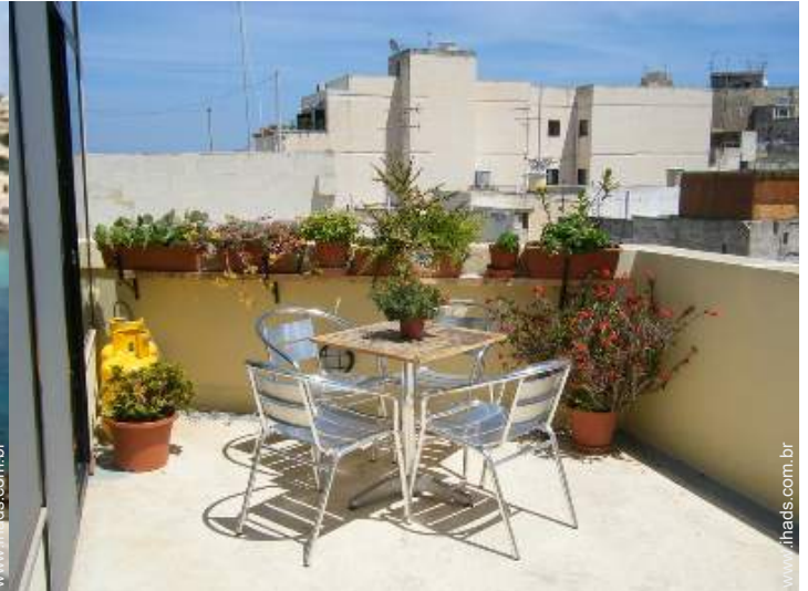
terraço no telhado