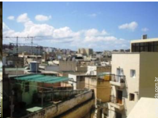
vista a partir do terraço sobre telhado