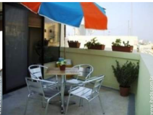
terraço no telhado