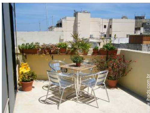
terraço no telhado