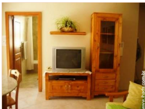
wi-fi (acesso à Internet sem fios)