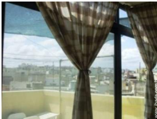
vista a partir do terraço sobre telhado