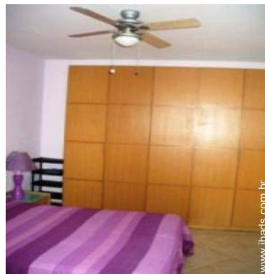
ventilador de parede