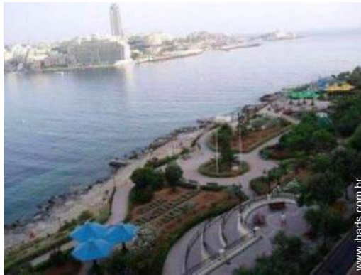
parque de lazer