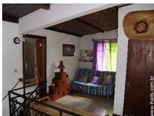
sofá(s) cama 1 pessoa