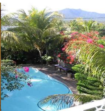
vista a partir do varandim