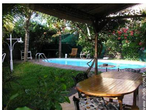
vista a partir da varanda