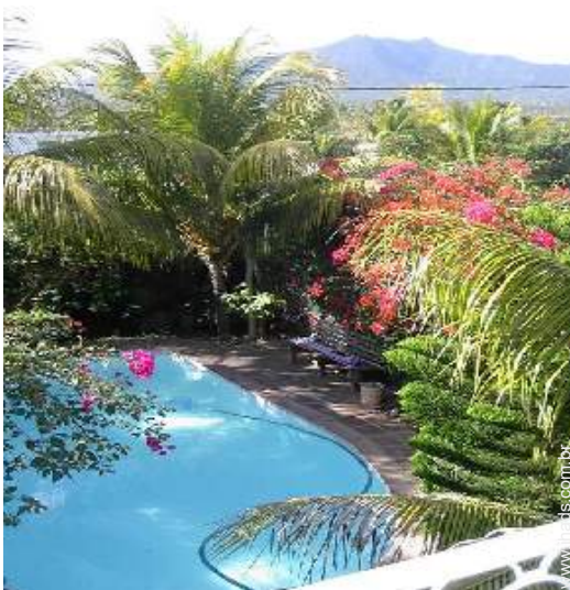
vista a partir do varandim