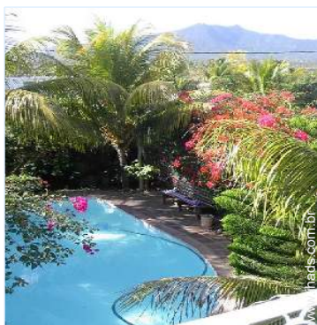
vista a partir do varandim