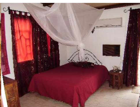
quarto de amigos