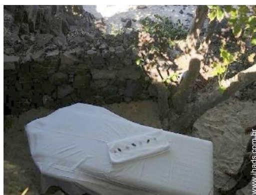
mesa de massagem