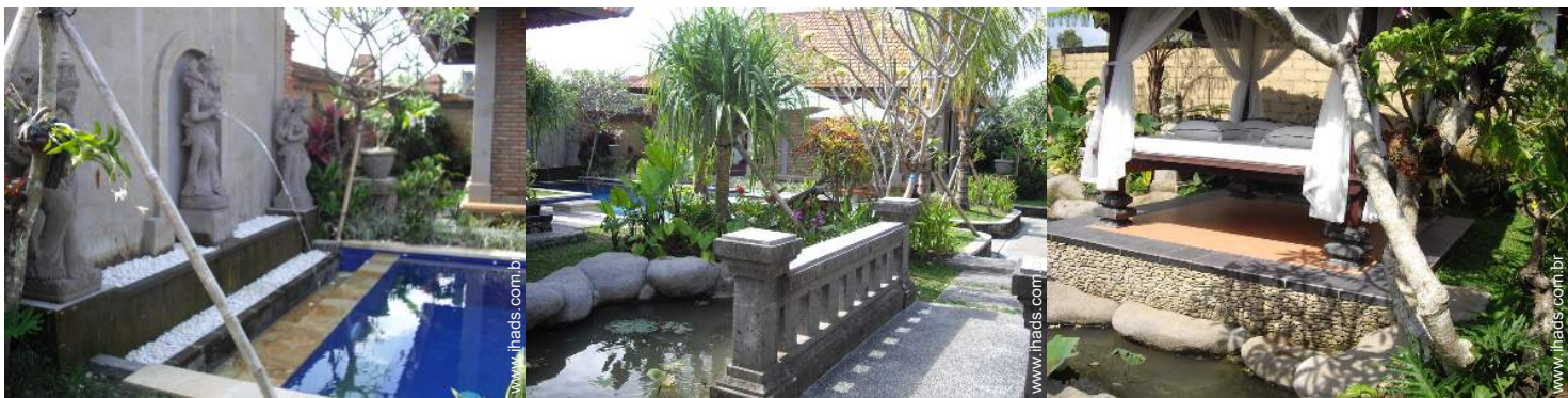
lago de jardim