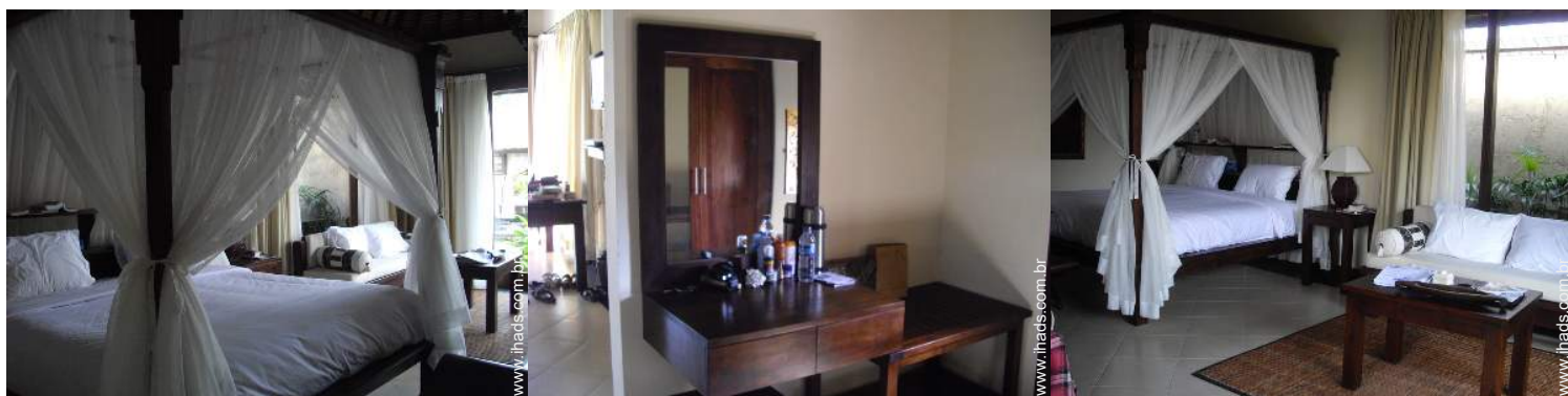
Dormida - cama(s)