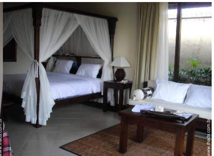
Dormida - cama(s)