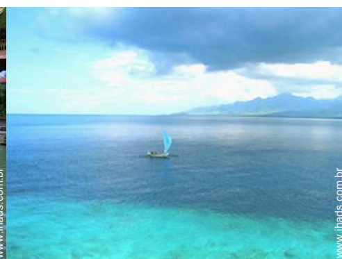
mergulho com tubo