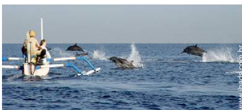
excursão de barco