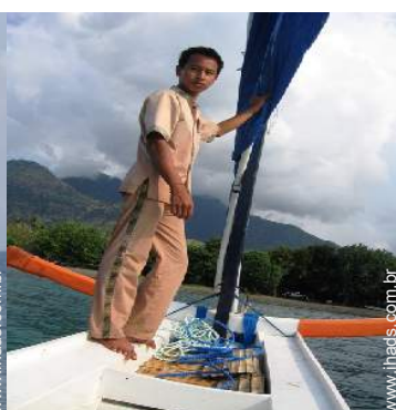
excursão de barco