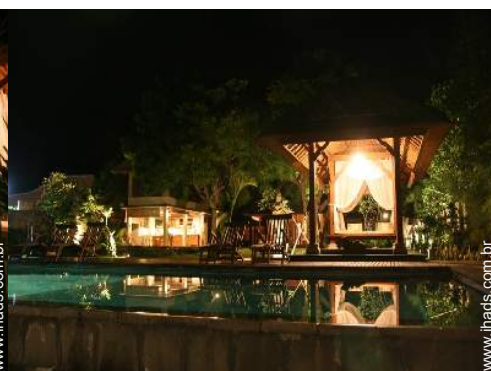
vista a partir da piscina