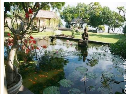
vista a partir da sala de jantar