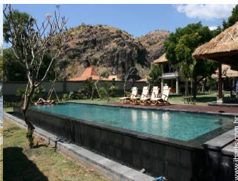
vista sobre o mar