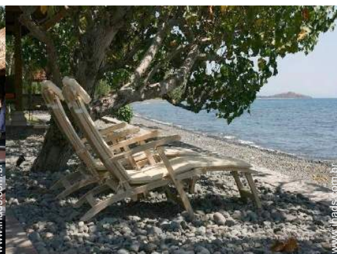
vista de mar