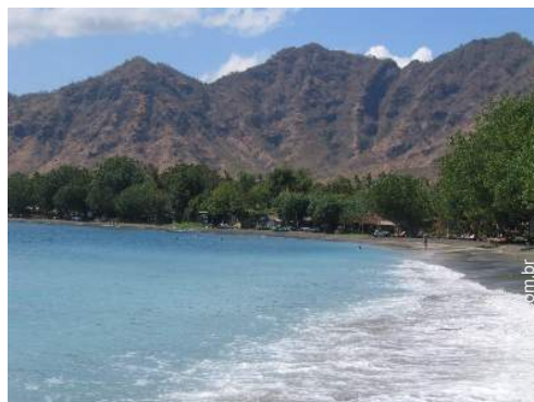
vista de mar