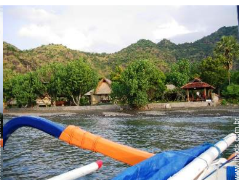
barco à vela