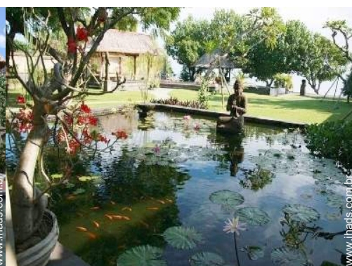
vista a partir da sala de jantar