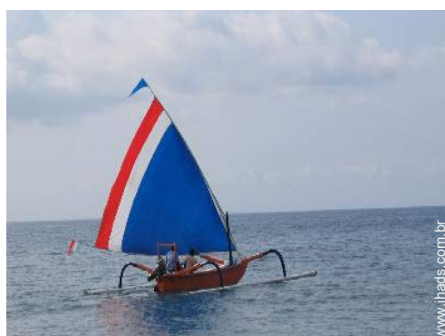
barco à vela