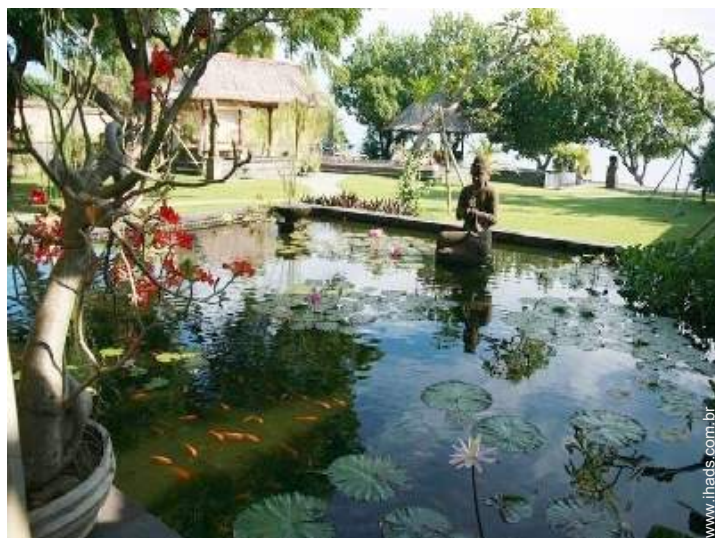
vista a partir da sala de jantar