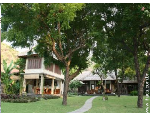
visão de conjunto