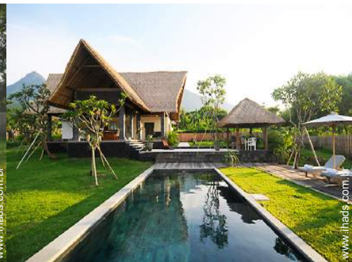
Vivenda de Luxo