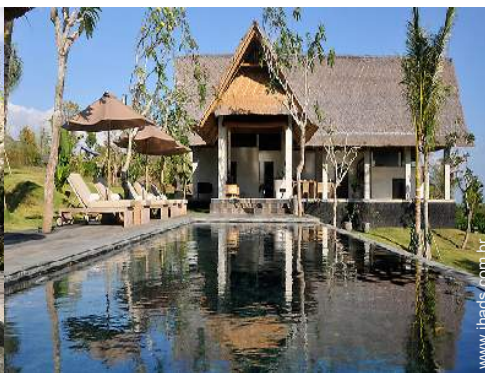
Vivenda de Luxo