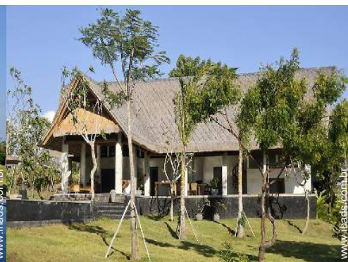
Vivenda de Luxo