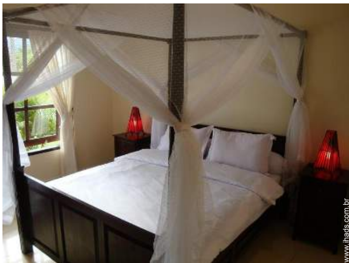
cama(s) de casal com dossel