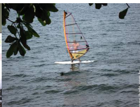
prancha(s) à vela