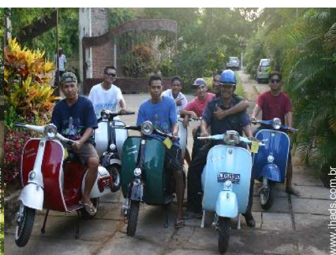
aluguer de moto/scooter