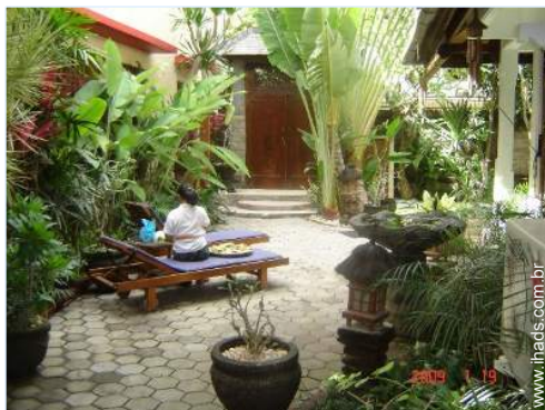
vista de pátio