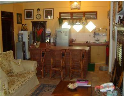
vista a partir do pátio