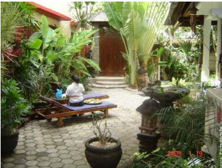
vista de pátio