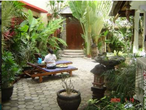
vista de pátio