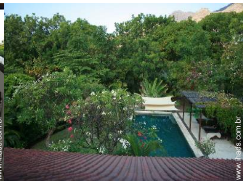
vista a partir do terraço sobre telhado