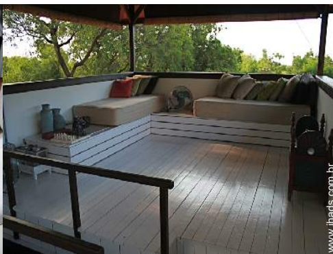
terraço no telhado