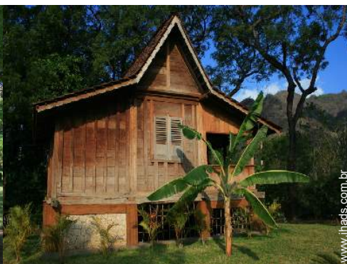
possibilidade de cama(s) extra(s)