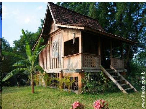
possibilidade de cama(s) extra(s)