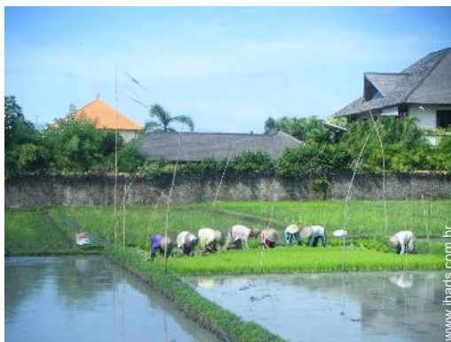
vista a partir do quarto