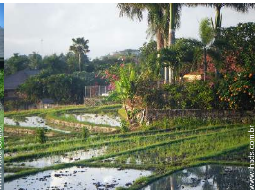
vista a partir da cozinha